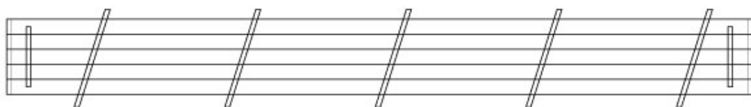
Rys.1 Błat podłogowy-widok z dołu

Zajmujemy się produkcją i sprzedażą podłóg namiotowych w systemie modułowym (blatów), które składają się zazwyczaj z 5 desek połączonych profilowanymi bokami -pióro -wpust oraz z dolnych legarów, które utrzymują całą konstrukcję.